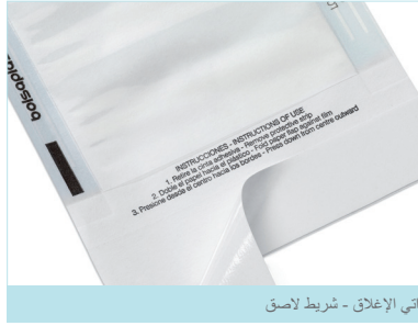
ذاتي الإغلاق - شريط لاصق