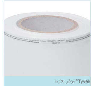
مؤشر بلازما Tyvek®