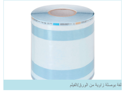
لفة بوصلة زاوية من الورق/الفيلم