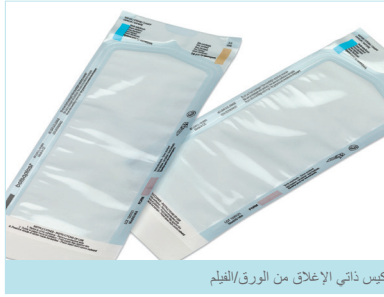
كيس ذاتي الإغلاق من الورق/الفيلم