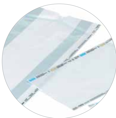
Papíroplastikový sáček skládaný