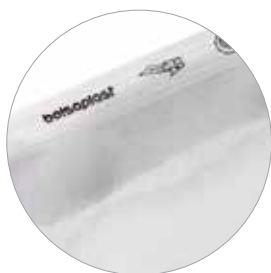
Instrukce k otevření obalu