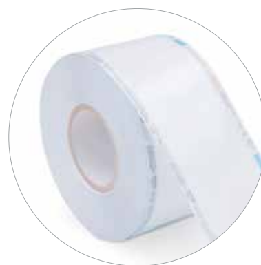
Papíroplastiková role plochá