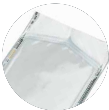
Papíroplastikový sáček plochý