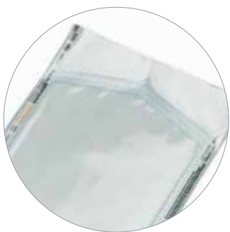
Busta carta/film plastico