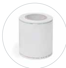
Rotolo Tyvek®/ Film plastico