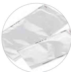
Busta Tyvek®/ Film plastico