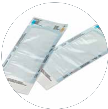
Busta autosigillante carta/film plastico