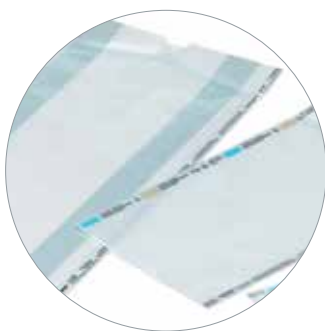
Busta a soffietto carta/film plastico