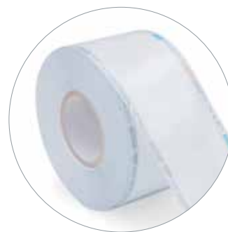
Rotolo carta/film plastico