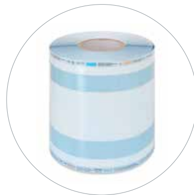
Rotolo a soffietto carta/film plastico