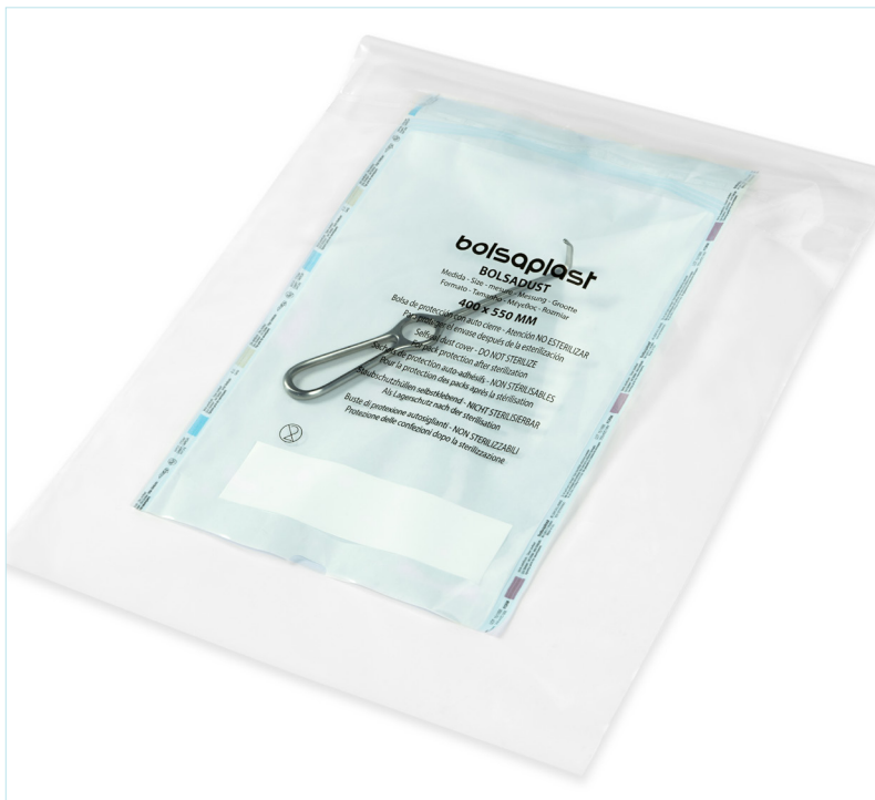
Totalmente transparente, para permitir ver el contenido sin necesidad de abrir el embalaje. Visualización perfecta del producto interior. Con un recuadro en blanco en el exterior, que permite la escritura