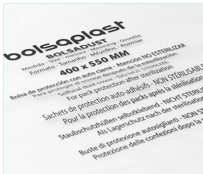
Información de producto y de uso en varios idiomas