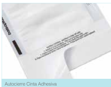
Autocierre Cinta Adhesiva