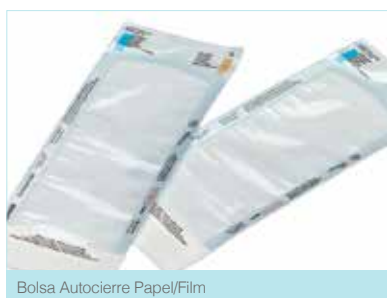
Bolsa Autocierre Papel/Film