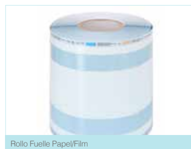
Rollo Fuelle Papel/Film