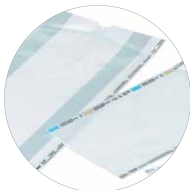
Papír/film redős tasak