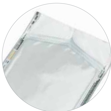
Papír/film lapos tasak