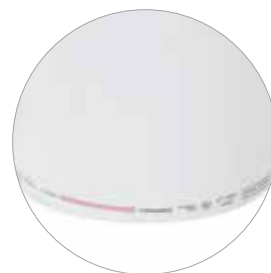
Plasma indikátor Tyvek®